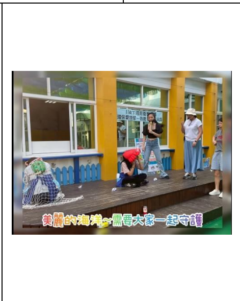
美麗的海灘~需要大家一起守護