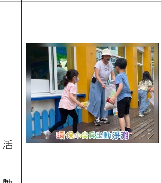
環保小尖兵出動淨灘