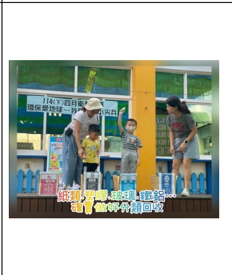
紙類、塑膠、玻璃、鐵鋁... 確實做好分類回收