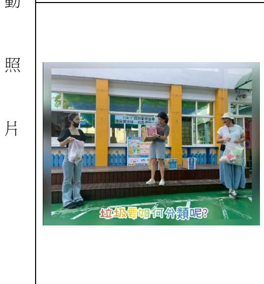
垃圾要如何分類呢?