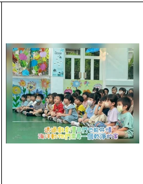
透過教育寶貝們也能共情海洋動物們需要一個乾淨的家