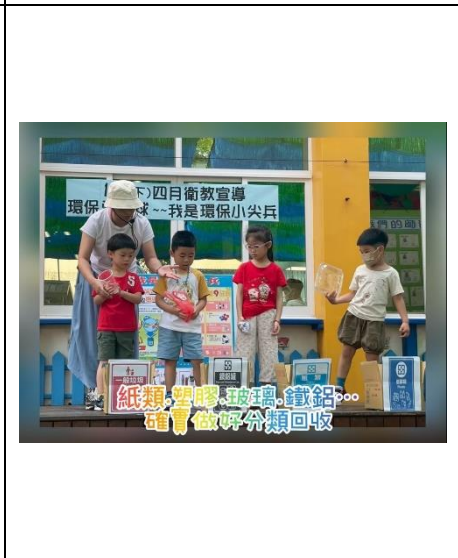
紙類、塑膠、玻璃、鐵鋁... 確實做好分類回收